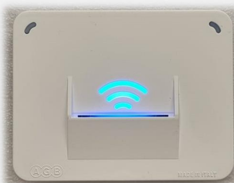
Fig.2 – Lettore Interno – Attivazione Utenze

Il gestore della struttura non deve far altro che attivare un codice per l'ospite (da App o Webapp) per l'alloggio assegnato, il codice si disattiverà automaticamente al primo ingresso e l'ospite troverà la card in camera che utilizzerà per gli ingressi successivi. Per l'attivazione delle utenze dovrà essere inserita la card all'interno del lettore interno (Fig.2).