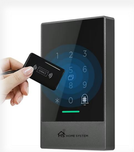
Fig.1 – Lettore Esterno - Accesso con Card Rfid

Il gestore della struttura non deve far altro che attivare un codice per l'ospite (da App o Webapp) per l'alloggio assegnato, il codice si disattiverà automaticamente al primo ingresso e l'ospite troverà la card in camera che utilizzerà per gli ingressi successivi. Per l'attivazione delle utenze dovrà essere inserita la card all'interno del lettore interno (Fig.2).